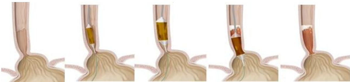
Figuur 1. RFA-ballonbehandeling

Bij de ballonbehandeling wordt een ballon in de slokdarm gebracht en voorzichtig opgeblazen. Om de behandelballon is een dunne metalen draad gewikkeld die de warmte afgeeft. De RFA-ballon wordt gedurende ongeveer één seconde ingeschakeld waardoor de slokdarmwand wordt verhit. Afhankelijk van de lengte van de Barrett slokdarm wordt de ballon verplaatst en nogmaals verhit (figuur 1). Gemiddeld hebben patiënten 1 ballon behandeling nodig.